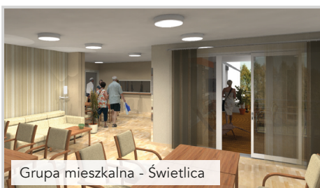
Grupa mieszkalna - Świetlica

Wysokość ponoszonych opłat ustalana jest wspólnie z pracownikiem socjalnym i uzależniona jest od dochodu osoby/rodziny. Osoba jest zobowiązana do ponoszenia opłat za pobyt w dps członka rodziny jeżeli dochód osoby samotnie gospodarującej/osoby w rodzinie jest wyższy niż 300% kryterium dochodowego osoby samotnie gospodarującej/na osobę w rodzinie określonego w ustawie o pomocy społecznej, jednak kwota pozostająca po wniesieniu opłaty nie może być niższa niż 300% tego kryterium.