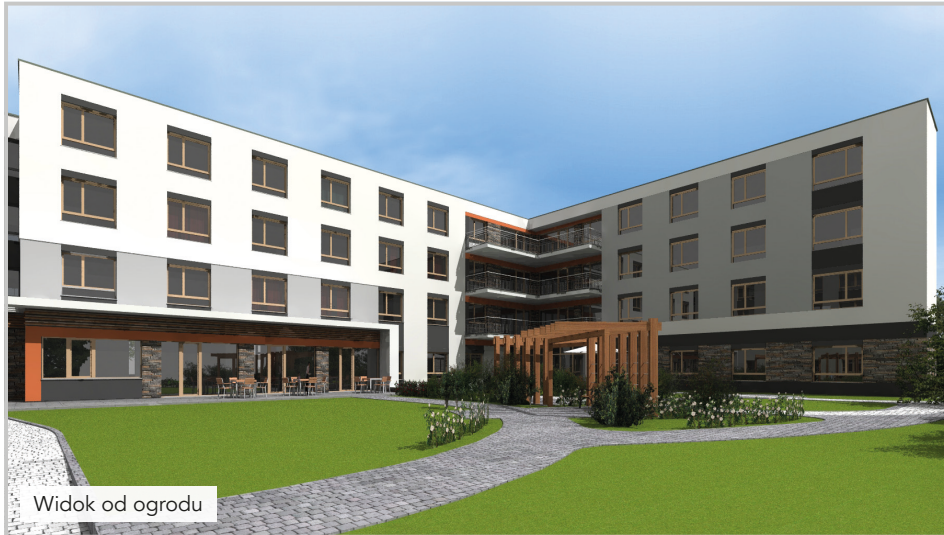
Widok od ogrodu

Centrum Kompetencyjne SENIOR RESIDENCE w Katowicach w dzielnicy Kostuchna jest DOMEM dla osób starszych i chorych na demencję, zaspakaja wszelkie ich potrzeby i gwarantuje rodzinną atmosferę i profesjonalną opiekę. To miejsce, w którym osoby starsze i często schorowane, poczuć się jak u siebie. A poza komfortowym pokojem i całonocną opieką otrzymają coś dodatkowego - przestrzeń spotkań i budowania relacji z innymi ludźmi w podobnym wieku, ale również z młodzieżą i dziećmi z okolicznych szkół, przedszkoli i parafii.